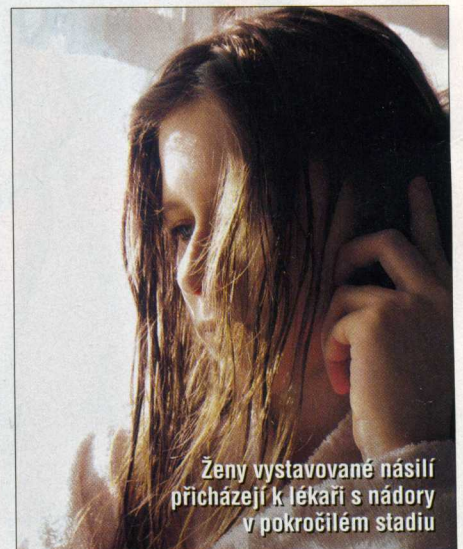
Ženy vystavované násilí přicházejí k lékaři s nádory v pokročilém stadiu

mají pro svou ekonomickou situaci ztížený přístup ke zdravotnímu pojištění a mnoho jich je závislých na návykových látkách. Častěji jde také o ženy rozvedené, v tíživé životní situaci. Do jaké míry jde o „kancerogenní“ souvislosti násilí a zneužívání a do jaké o důsledky psychického postoje samotných žen ke svému zdraví, který může být v důsledku těchto negativních zkušeností značně zhoršený, to studie nevysvětluje.